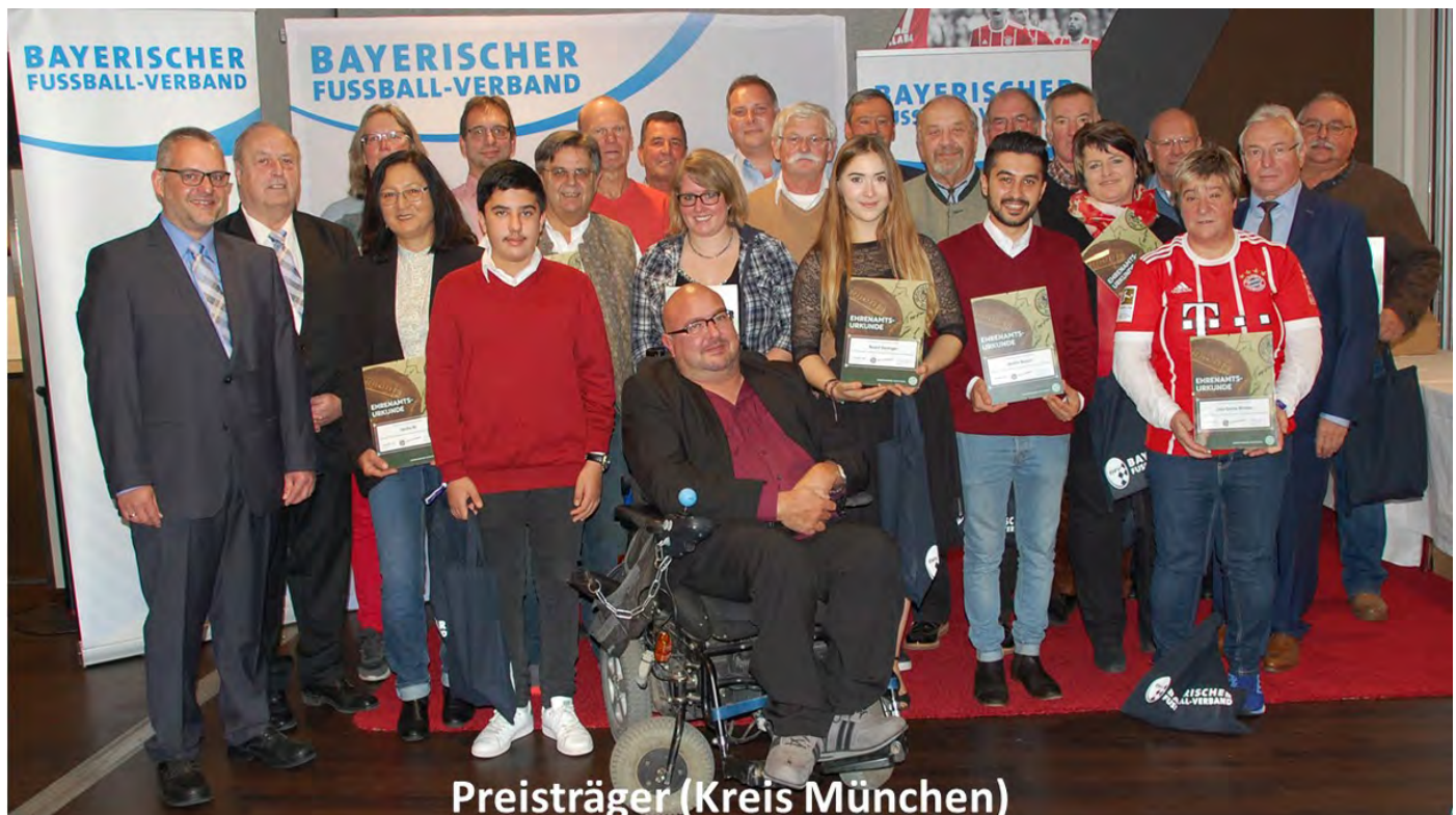
Preisträger (Kreis München)